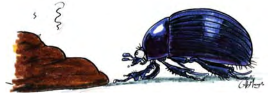
Dessin Gilles Macagno

Une vache émet en moyenne 12 bouses par jour. Festin royal pour les uns, lieu de rendez-vous amoureux, doux berceau ou encore zone de chasse foisonnante pour les autres... Pour le naturaliste, la bouse est un fantastique micro-écosystème riche de découvertes !